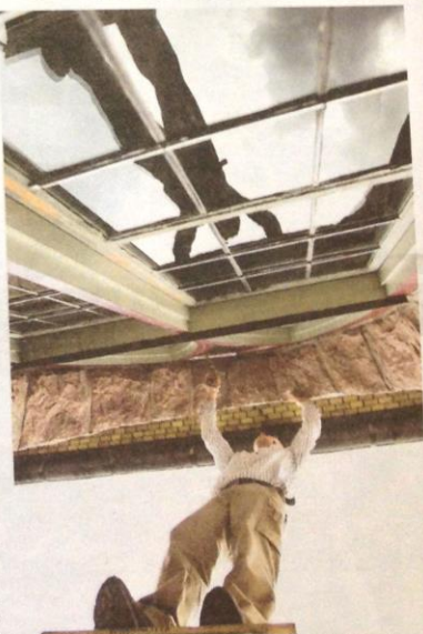
De renoverade fönstren är målade med linoljefärg och nyansen är den samma som när fönstren först sattes upp. Varje fönsterbåge är unik och passar bara på ett ställe. Cirka två månader har renoveringen tagit.