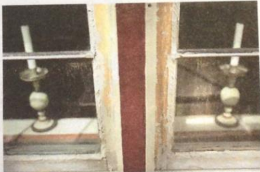
Än så länge är det enbart ytterfönstren som renoveras. Innerfönstren får klara sig ett tag till.

- Det är väl värt att bevara dessa bågar som oftast är fina fortfarande efter två-